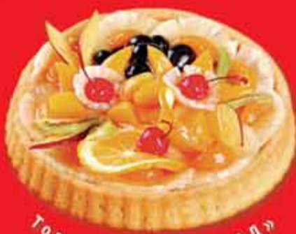
Торт «РАЙСКИЙ САД»