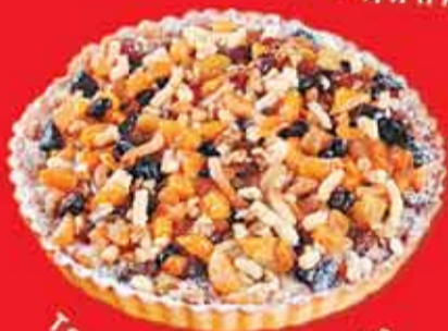
Торт «БУКЕТ АЗИИ»