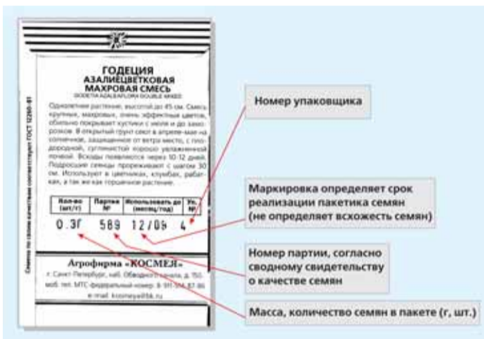
На рисунке указано, на что необходимо обратить внимание при покупке пакетированных семян.

В случае обнаружения нарушений при реализации семян и посадочного материала обращайтесь в Отдел по надзору за безопасным обращением с пестицидами и агрохимикатами и семенного контроля Управления Россельхознадзора. Телефоны: 600-19-17, 600-19-18.