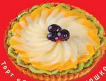
Торт «ФРУКТОВОЕ ЛУКОШКО» (с грушей)

Дорогие сладкоежки! Для вас хорошая новость: петербургская кондитерская фабрика «КАРАТ ПЛЮС» выпустила в продажу серию новых тортов!