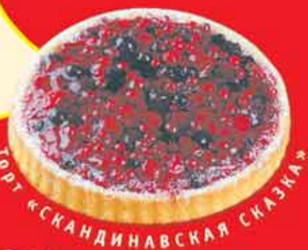
Торт «СКАНДИНАВСКАЯ СКАЗКА»