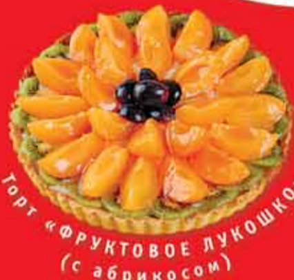
Торт «ФРУКТОВОЕ ЛУКОШКО» (с абрикосом)